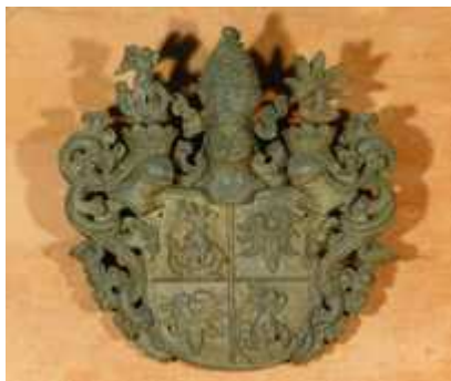
Abb. 1: Abtswappen v. Hodenberg mit Adlerflügel und St. Michael, Foto: Klosterkammer Hannover.

Vor einiger Zeit wurde das Kunstwerk abgehängt. Die zuständige Klosterkammer Hannover war daran nicht beteiligt und wurde davon auch nicht informiert. Sie besitzt jedoch ein deutliches Foto von dem Wappenschild an seinem alten Platz.