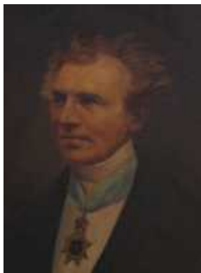
Abb. 2: Wilhelm v. Hodenberg (1786–1861), 1877, Museum f. d. Fürstentum Lüneburg.

Auch das Lüneburger Fürstentum–Museum und der jetzige Kirchenvorstand wissen nichts von dem Verbleib des verschwundenen Schnitzwerks. Es wird einen plausiblen Grund für seine Entfernung gegeben haben. Der ist indes unbekannt und wurde offensichtlich nicht dokumentiert. Vielleicht sollte es renoviert werden? Oder es wurde nur gut verpackt in einem Lagerraum abgestellt und dort nach einem „Personalwechsel“ schlicht vergessen? Dann lohnte es sich, danach zu suchen.